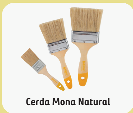
Cerda Mona Natural