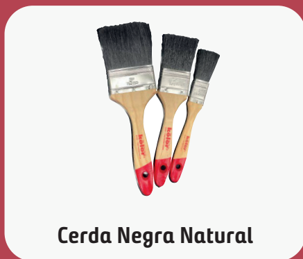
Cerda Negra Natural