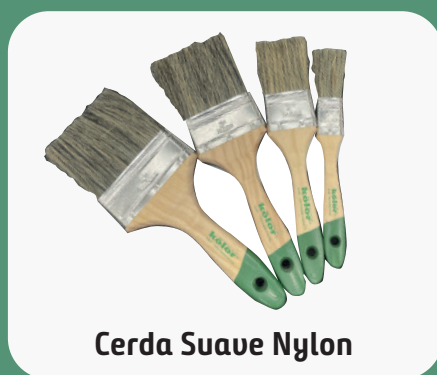
Cerda Suave Nylon