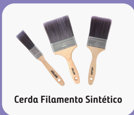
Cerda Filamento Sintético